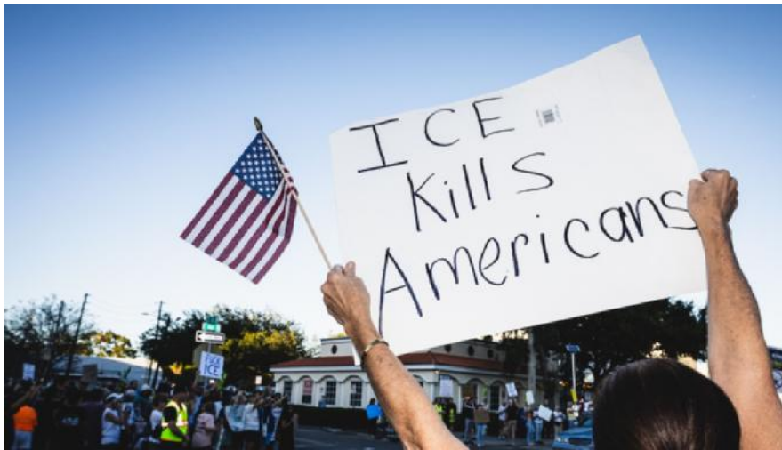
Svolta autoritaria Manifestazione di protesta a St. Petersburg, in Florida contro gli agenti dell'Ice