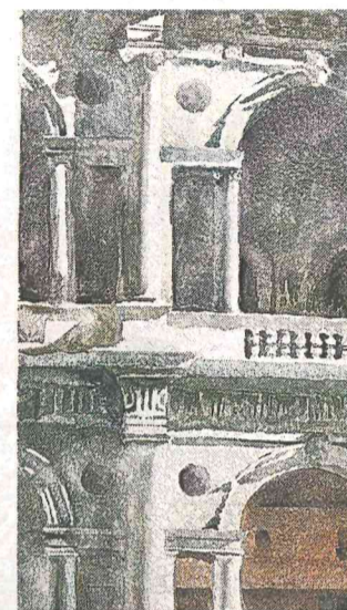
Tracca, uno scorcio della città

Tracca, vicentino nato a Castelgomberto e da sempre residente in città, le domina entrambe con la rinomata perizia, l'appassionato procedere, l'umiltà nei confronti dell'assoluto dell'arte, prendendo come maestra la verità di quel che vede. Captan-