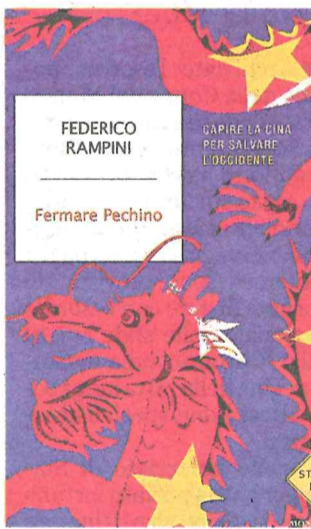
La copertina del libro Mondadori

“La crisi più importante per gli Usa non è stata la pandemia ma la recessione avvenuta nel 2008”