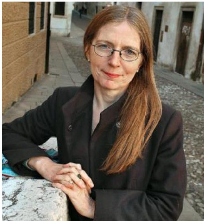
Mariapia Veladiano: la scrittrice berica oggi in anteprima nazionale

Come nel suo fortunato romanzo d'esordio, la protagonista è una figura femminile che racconta la storia della sua vita in prima persona. Solo che qui si tratta di una donna matura, non più di una ragazza terribilmente brutta. Il suo nome, Ildegarda, le è stato dato dalla madre, una contadina esperta in erbe medicinali, in onore di Hildegard von Bingen, la grande santa erborista del dodicesimo secolo. La vita di questa santa e il contatto con i mali delle persone che venivano a cercare rimedi naturali dalla madre la spingono a studiare teologia, "con la pretesa spavalda di interrogare Dio sulle sue terribili responsabilità". Ildegarda, che fa la giornalista per una rivista cattolica, vive in un paese della piana pianura lombarda chiamato Villacadra, con il figlio Tommaso e il marito Pierre. Quest'ultimo, però, porta dentro di sé un'inguaribile sofferenza e una cieca sfiducia nei confronti della vita legate alla sua infanzia infelice e al rapporto tormentato con la madre. La nascita del figlio, da lui non voluto, lo fa sprofondare in una voragine senza ritorno che lo porta ad abbandonare la famiglia. Dopo la fuga del marito, a Natale, la donna si rifugia a Campodalba, in Alto Adige, a duemila metri, in un albergo sepolto dalla neve. In questo luogo, dove il dialogo con il divino diventa più naturale, incontrerà un'altra anima sofferente come lei, Dieter, un pastore luterano di Heidelberg, abbandonato dalla moglie in seguito alla morte del loro figlio.