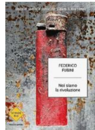
La copertina del libro

può sfociare nel sangue; in Etiopia può catapultare nel XXI secolo i coltivatori di caffè locali che vivevano in una stagnante epoca neocoloniale, mentre in Bhutan, grazie a un demiurgo illuminato, può dar vita a un armonioso presente che fonde passato e futuro. E quando la voglia di cambiare tocca una città languente come Catanzaro - sede dei principali call center nazionali con un esercito di rassegnati precari - ecco un outsider politico che riesce a spezzare gli schemi del voto di scambio e a far incetta di preferenze tra i giovani.