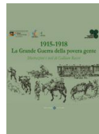
La copertina del libro

L'ingresso è libero fino a esaurimento posti. ●