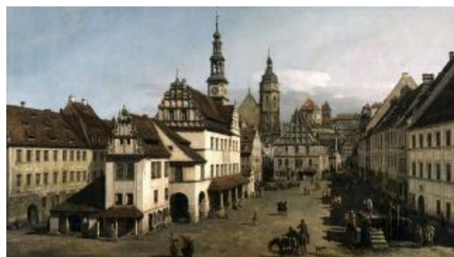
Bernardo Bellotto, "La piazza del Mercato di Pirna", 1753-1754

Canaletto s'impose sul teatro europeo grazie ai particolari procedimenti compositi-