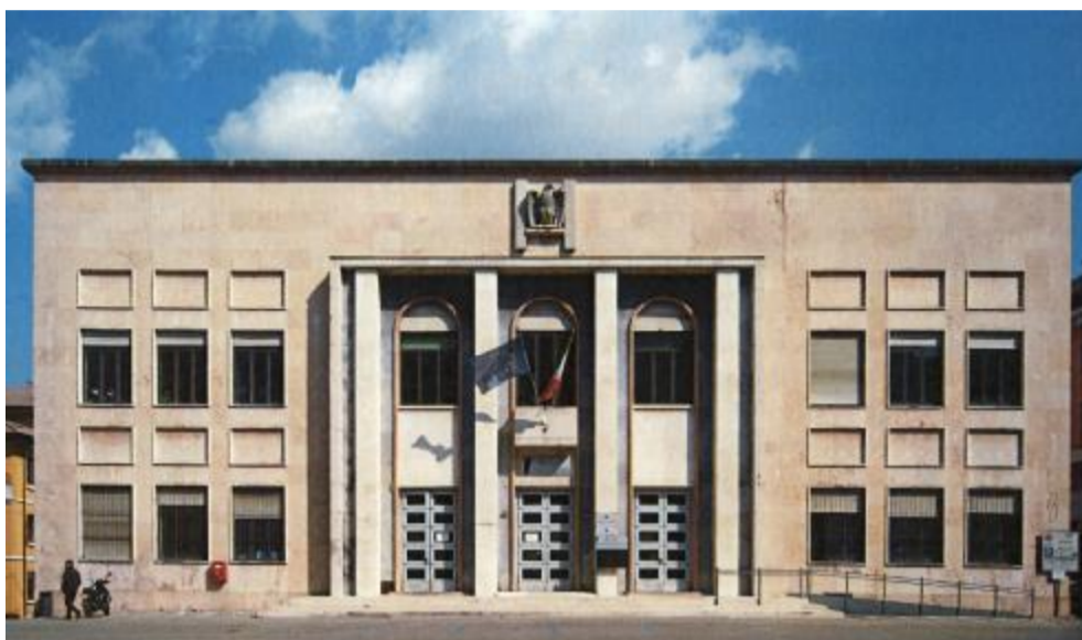
La Casa del Fascio oggi, in centro a Valdagno

da parte dell'amministrazione pubblica era iniziato, fin dal '32, un progetto mai realizzato di trasformazione urbana del centro storico di Valdagno da connettere alla nuova città. Progettato dall'architetto veneziano Gildo Valconi coadiuvato dall'ingegnere Paolo Zaupa di Cornedo Vicentino, l'edificio presenta l'inedita caratteristica della doppia facciata: una più elevata su piazza Dante e una a livello più basso su piazzale Acqui sopra viale Trento, costituendo così una delle cerniere di collegamento tra città vecchia e città nuova, che creava un dialogo, oggi interrotto, tra edificio e contesto. I due giovani architetti autori della tesi fanno un lavoro molto puntuale di rilievo grafico e analisi delle forme, e classificano i materiali interni ed esterni dell'edificio mettendo in evidenza cromati-