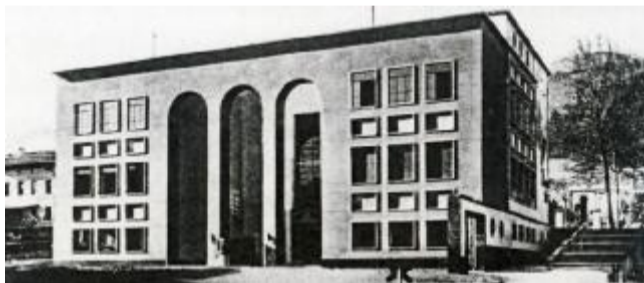
Prospetto su Piazzale Acqui in una cartolina d'epoca

Una domanda sorge anche sulla riconessione possibile al centro attraverso il verde urbano