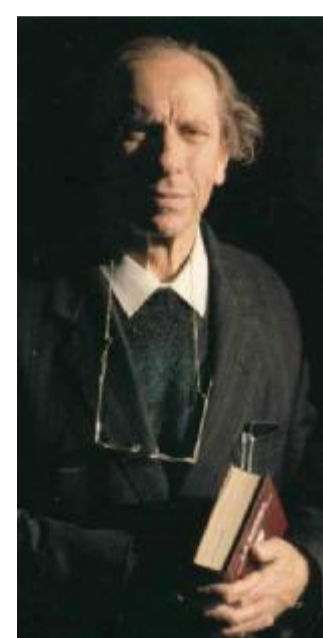
Padre Turoldo (1916-1992)

Un fatto mai accaduto prima, salvo ricordare con immensa nostalgia e ammirazione