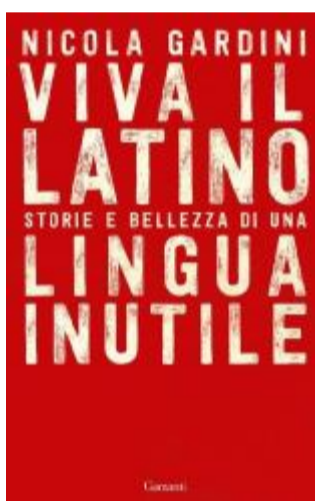
La copertina del libro

A capire perché parliamo in un certo modo, perché pensiamo in un certo modo, dove si sono formati i nostri valori culturali e i nostri sentimenti. Il latino è stato il luogo d'incontro del paganesimo e del cristianesimo: pensiamo alla virtù che nasce militare e diventa etico-religiosa nel cristianesimo. Ma al di là di questi esempi, il latino ci dà una prospettiva: tendiamo a interpretare il pre-