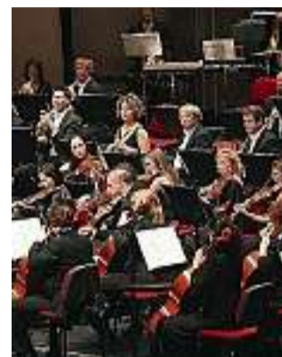
L'Orchestra del Teatro Olimpico

Durante la preparazione e l'esecuzione di alcuni concerti della stagione, l'Orchestra del Teatro Olimpico avrà a seguir-la un "occhio" speciale: quello dei fotografi professionisti dell'Associazione Artigiani - Confartigianato Vicenza. L'opera di documentazione fornirà anche il materiale da cui selezionare i soggetti che andranno a costituire una mostra, a fine anno. Il progetto, che si avvia in questi giorni, rientra nelle iniziative speciali dell'Orchestra in occasione del ventennale della sua nascita, che ricorre appunto quest'anno.