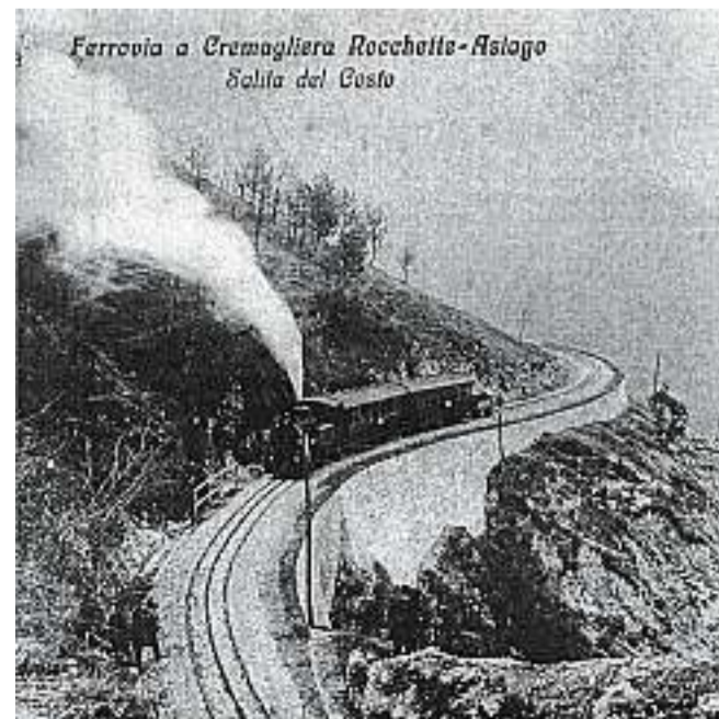
Una bella immagine d'epoca del trenino che s'inerpicava sul Costo